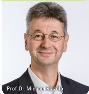
Prof. Dr. Michael Piazzolo